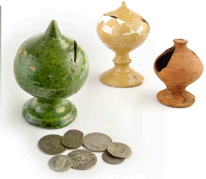
Bol- en uivormige spaarpotten in diverse uitvoeringen, opgegraven in Haarlem.

De geldwisselaar wist precies wat iedere munt waard was en kende de onderlinge verhouding tussen de munten. Ook controleerde hij of er geen valse munten in omloop waren. Daarnaast werd van munten nog wel eens stiekem een klein randje afgeknipt, om zo aan waardevol edelmetaal te komen, en een grotere waarde voor de munt te vangen dan dat hij inmiddels door dat knippen waard was. Daarom werd het gewicht van een munt gecontroleerd met een muntbalans.