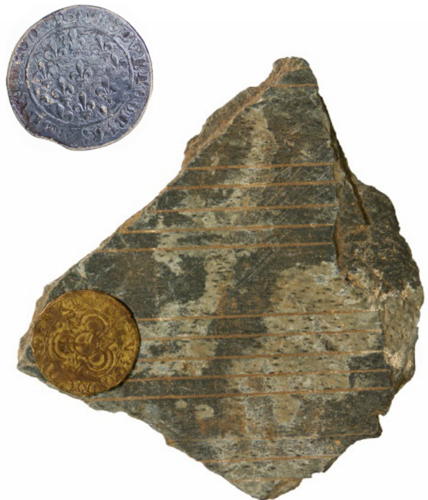
Telraam en rekenpenningen, gevonden aan de Grote Markt en Damstraat.

De geldwisselaar wist precies wat iedere munt waard was en kende de onderlinge verhouding tussen de munten. Ook controleerde hij of er geen valse munten in omloop waren. Daarnaast werd van munten nog wel eens stiekem een klein randje afgeknipt, om zo aan waardevol edelmetaal te komen, en een grotere waarde voor de munt te vangen dan dat hij inmiddels door dat knippen waard was. Daarom werd het gewicht van een munt gecontroleerd met een muntbalans.